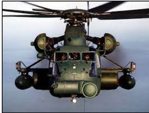
Figura 03: MH-53J Enhanced Pave Low III.

Helicóptero utilitário da Força Aérea Americana, parte da frota do 20th Special Operation Squadron. Possuía um equipamento de navegação considerado “estado da arte” à época, o Global Positioning System (GPS), que nunca haviam sido testado em combate anteriormente. Era equipado ainda com Metralhadora Lateral M2 Browning .50 pol ou M134 Minigun 7.62mm.