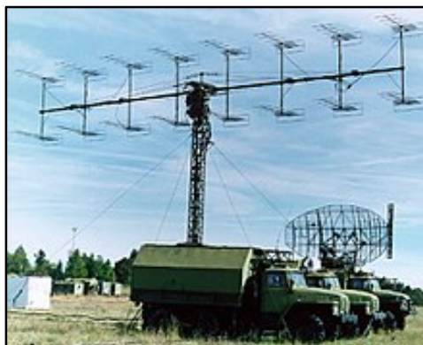
Figura 04: Radar P-18 “Spoon Rest”. Produzido pela União Soviética na década de 1970, alcance de 250 Km e altura de 35 Km.

Os alvos consistiam em duas posições de radares integrados com a defesa aérea (IADS). Estima-se que estas instalações eram compostas por geradores, centros de comando e controle, sistemas de proteção Surface to Air Missile (SAM) e Antiaéreo, além dos próprios radares. O Departamento de Defesa americano designava os radares inimigos com nomes de personagens de histórias em quadrinhos para facilitar a identificação, com isso, radares soviéticos como o R-18, P-15M e SA-2 usados pelo Iraque recebiam nomes como “Spoon Rest”, “Flat Face” e “Squat Eye”.