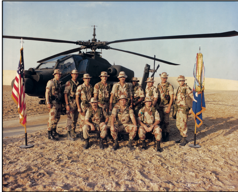
Figura 01: Tripulações da Força Tarefa Normandia, após a Operação Eager Anvil.