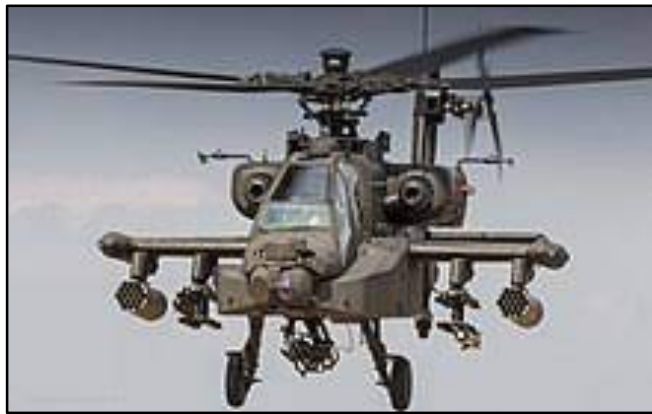
Figura 02: AH-64 Apache.

Aeronave de ataque do Exército Americano, parte da frota da 101st Air Assault Division. Utilizava o Sistema de navegação Doppler Attitude-Heading, que não possuía a precisão necessária para a missão. Era equipado com Mísseis AGM – 114 Laser Guided Hellfire, Foguetes Hydra 70 e Metralhadora .30mm.